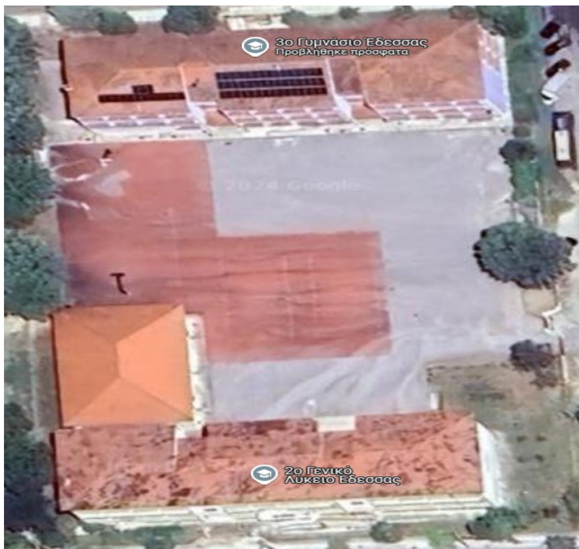
Εικόνα 1. 3 ο Γυμνάσιο & 2 ο Λύκειο

Η παρούσα έκθεση αφορά την αναβάθμιση του προαυλίου χώρου του 2 ου Λυκείου και 3 ου Γυμνασίου του Δήμου Έδεσσας .